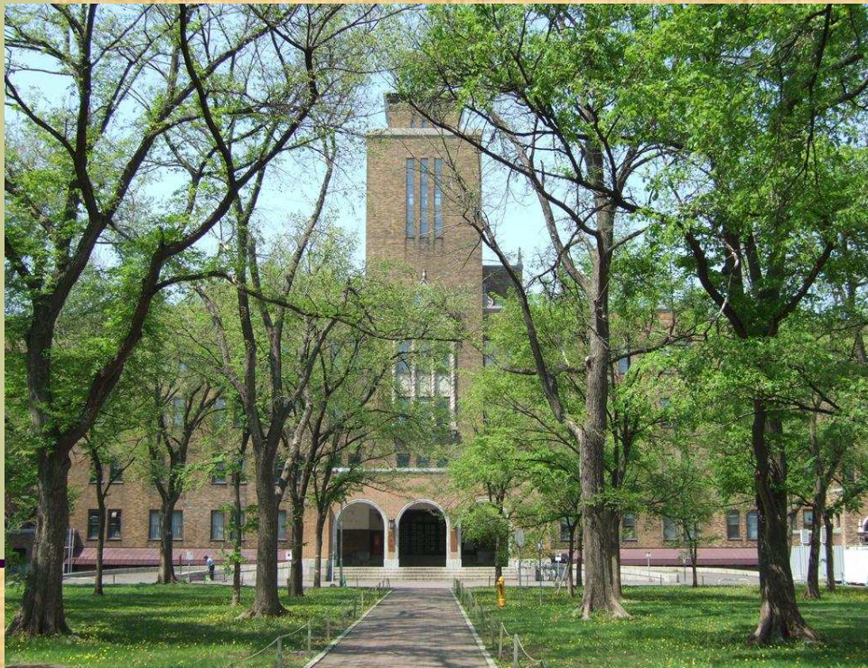
北海道大學校本部